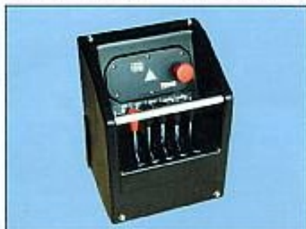
Steuventil und BOSS® – Sicherheits- und Steuersystem sind in einem schützenden Steuerkasten untergebracht.