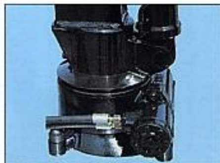
Das Schwenkgehäuse aus Stahlguß mit eingekapseltem selbsthemmendem Schneckengetriebe verhindert das Eindringen von Schmutz und Wasser.