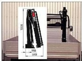
Der HIAB 013 T erfordert auf der Pritsche minimal Platz. Seine niedrige Bauhöhe ermöglicht die Unterbringung unter den meisten Planenaufbauten.

Zeit ist Geld – und Hiab hilft, Ihnen diese Zeit hereinzuholen.