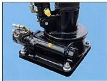
Das Schwenksystem ist in einem mit O-Ring abgedichtetem Kranfuß aus Stahl eingekapselt und somit vor Wasser und Schmutz geschützt.