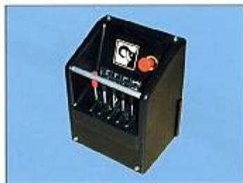
Das Steuergerät deckt das Steuerventil ab, eine Aluminiumstange schützt die Steuerhebel.